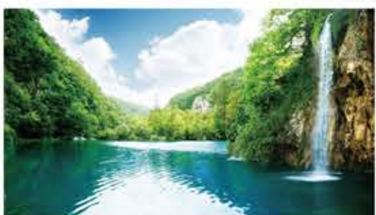
宇宙人生所有萬事萬物，都由四大種：地、水、火、風等條件和合而成。

是「四大皆有」，空與有是一體不二的。你的口袋不空，怎麼能攜帶金銀用物；你的腸胃不空、口腔不空、鼻孔不空，能生存下去嗎？空地、空間，是多麼的寶貴！一個健全的國家、都市，都要留多少空間，給人民生活得更加怡情養性；現在的大都會市區，一尺地也都是上百萬元，你說，空不好嗎？為了爭取一個空位，和人爭吵；為了爭取一點空地，甚至告到法院，和人打官司。沒有空間、沒有空地，哪裡能建房屋；空間對你不是那麼的重要嗎？空有什麼不好？可是你平常又怕空，這是非常矛盾的。